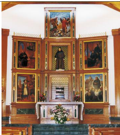
Retablo de la capilla de la «Residencia Madre Geneveva» de Toledo en España. Constituye una síntesis de las principales facetas de la Madre Geneveva. ↑

—¿Y las dos pesetas? Las dos pesetas fueron a parar a manos de los pobres. ■